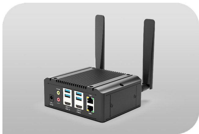
圖 1 Edge AI Box 產品外觀